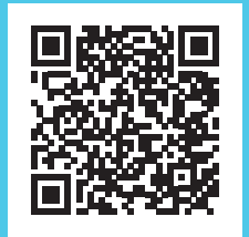
Ryan Health | Frederick Douglass