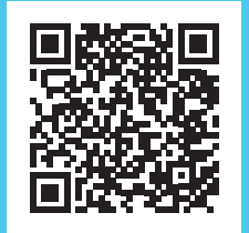
Ryan Health | Frederick Douglass