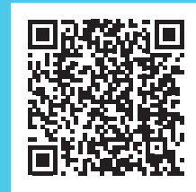
Ryan Health | Adair

Scan the QR code to make an appointment at Ryan Health | Adair or Ryan Health | Frederick Douglass, your nearest centers. Our staff is ready to welcome you with the same quality care you received at PS180.